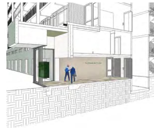
Impressie van de nieuwe hoofdentree

De planning van de werkzaamheden aan de algemene ruimten en de werkzaamheden die buiten plaats vinden wil nog wel eens wisselen. Dit heeft met verschillende dingen te maken. Sommige werkzaamheden zijn afhankelijk van het weer. Wij proberen de informatie altijd zo duidelijk mogelijk over te brengen aan de bewoners. Is iets niet duidelijk neemt u dan contact op met onze bewonerscoördinatoren, zij informeren u graag.